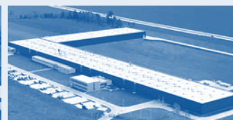
Hörmann Legnica Sp. z o.o., Польша