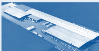
Hörmann LLC, Montgomery IL, США