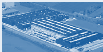
Hörmann KG Werne