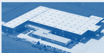
Hörmann KG Dissen