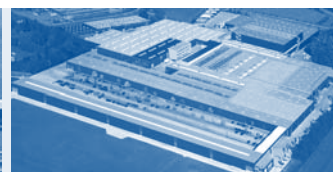
Hörmann KG Brockhagen