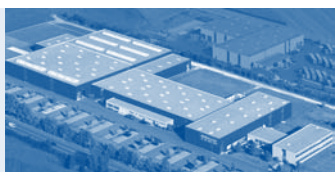
Hörmann KG Antriebstechnik