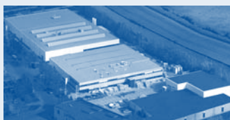
Hörmann Alkmaar B.V., Нидерланды