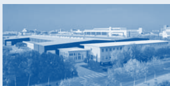
Hörmann Beijing, Китай