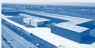
Hörmann Tianjin, Китай