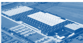
Hörmann KG Brandis