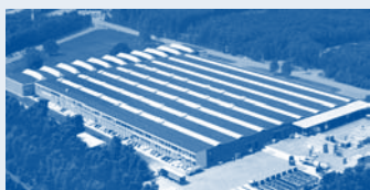
Hörmann Genk NV, Бельгия