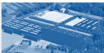
Hörmann KG Amshausen