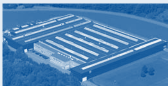
Hörmann KG Eckelhausen