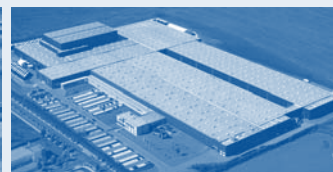
Hörmann KG Ichtershausen