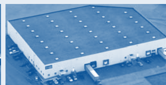
Hörmann Flexon, Leetsdale PA, США

Нörmann - единственный производитель на международном рынке, предлагающий «из одних рук» все основные строительные элементы, которые изготавливаются на высокоспециализированных предприятиях в соответствии с новейшими техническими достижениями. Имея широкую торговую и сервисную сеть в Европе и представительства в Америке и Китае, Нörmann является надежным поставщиком высококачественных строительных конструкций. Нörmann - качество без компромиссов.