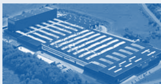
Hörmann KG Freisen